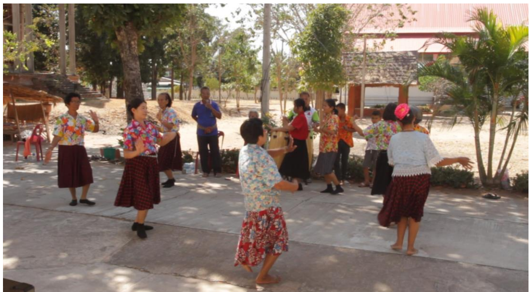
ภาพที่ 4.4 การยืนและการแสดงท่าทางการฟ้อนรำของผู้แสดงในชั้นเล่นกองก้า 2