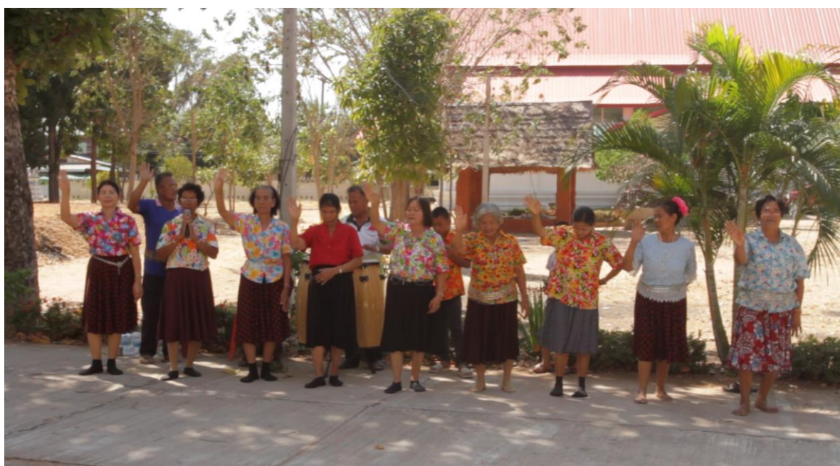
ภาพที่ 4.5 การยืนของผู้แสดงในชั้นจบการเล่่นกองก้า