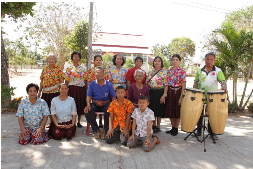
ภาพที่ 4.1 คณะนักแสดง นักร้องและนักดนตรี การเล่นพื้นบ้านกองก้า

ขั้นตอนการเล่นกองก้า ของการเล่นพื้นบ้านกองก้า อำเภอบัวใหญ่ จังหวัดนครราชสีมา มี 3 ขั้นตอน ด้วยกัน โดยแต่ละขั้นตอนจะประกอบไปด้วยการร้องเพลง การบรรเลงดนตรี และการ