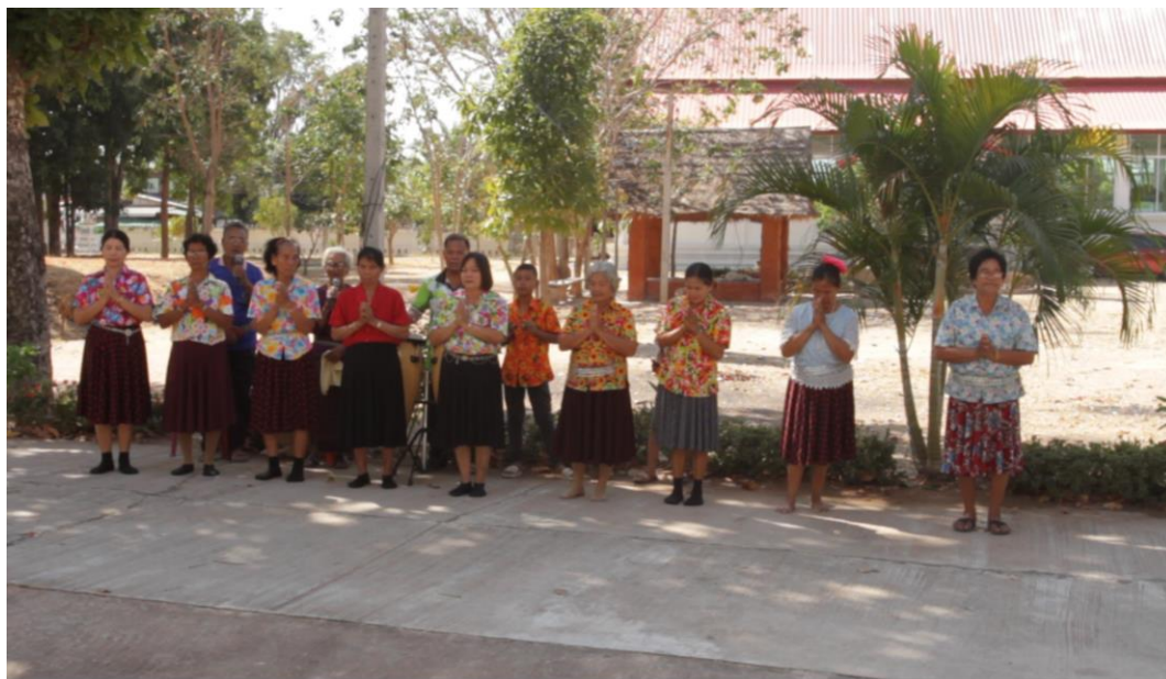
ภาพที่ 4.2 การยืนของผู้แสดงในขั้นตอนเริ่มเล่น

ชั้นเริ่มต้นเล่นกองก้านี้ นักแสดง นักร้อง และนักดนตรี จะยืนเรียงกันตามตำแหน่งต่าง ๆ โดยนักดนตรีจะยืนอยู่หลังสุด พร้อมทั้งตั้งเครื่องดนตรี ได้แก่ กลองทอมอยู่ด้านหน้าผู้ตีกลอง ด้านซ้ายมือของผู้ตีกลอง จะเป็นนักดนตรีที่ตีฉิ่ง และนักดนตรีที่ตีฉาบเล็ก ยืนเรียงทางซ้ายมือตามลำดับ ด้านขวามือของผู้ตีกลอง จะเป็นตำแหน่งของนักร้องทั้งชายและหญิง ยืนคู่กันโดยผู้หญิงยืนอยู่ทางซ้ายมือของผู้ชาย ส่วนนักแสดงจะยืนเรียงกันเป็นแถวหน้ากระดาน ทางด้านหน้าของนักดนตรีและนักร้อง รูปภาพที่ 4.2 ประกอบ