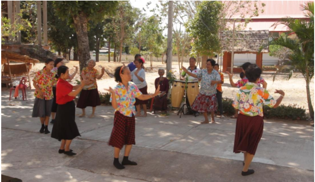
ภาพที่ 4.3 การยืนและการแสดงท่าทางการฟ้อนรำของผู้แสดงในชั้นเล่นกองก้า 1 ที่มา : อรุณช อินตา. (2562).